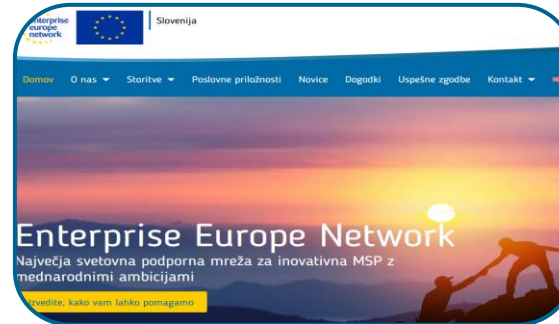
Uradna spletna stran